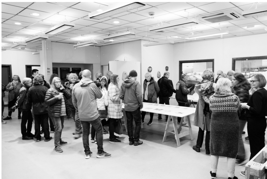
Åpning av deler av Varangerfestivalprosjekt 2019. Kunstutsalg og Varangerfestivalplakatutstilling i gamle Narvesen.