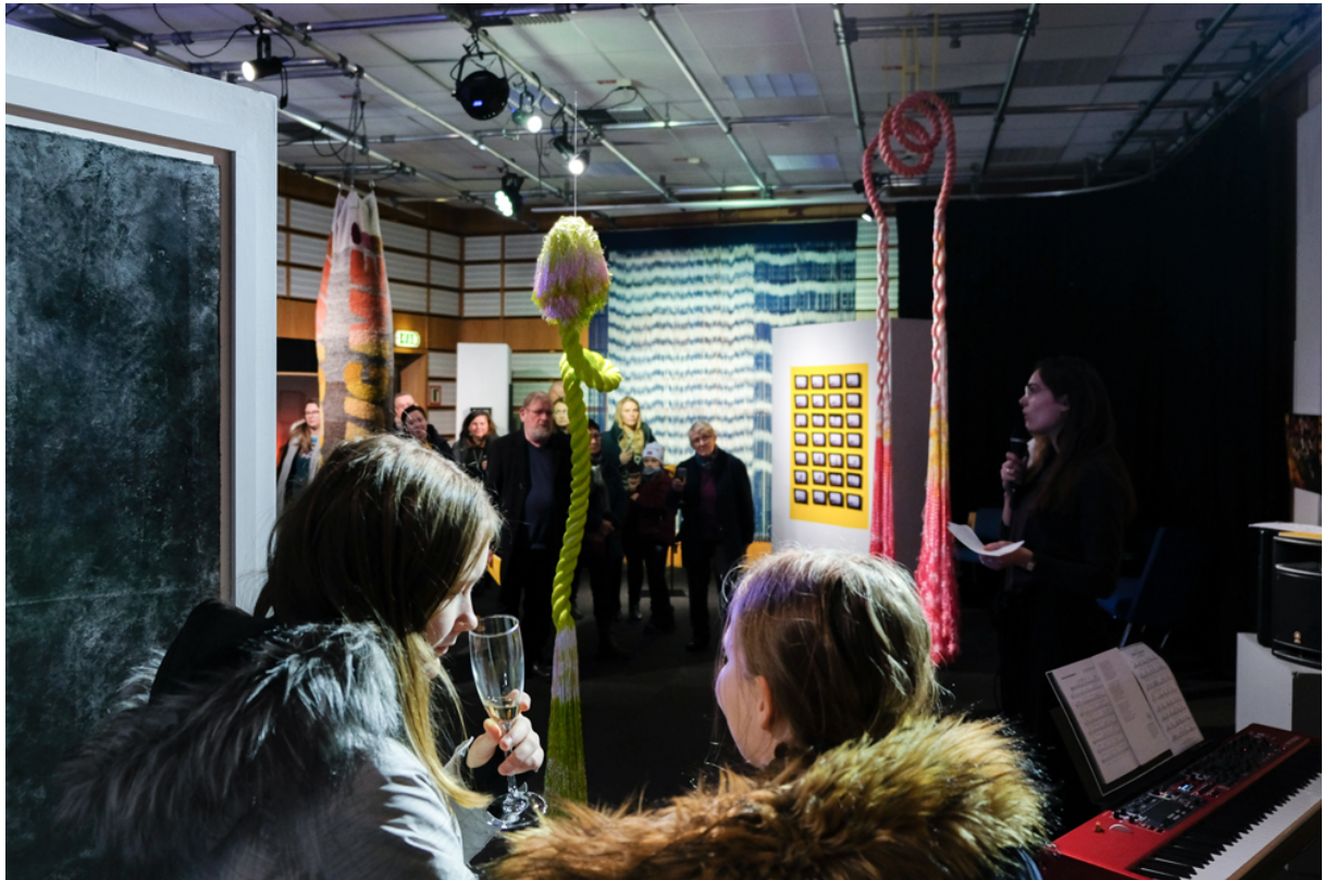
Åpning av Nordnorsken 2019.